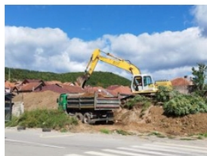
Uništavanje Latinske crkve

“Za ovo višestruko kršenje zakona, ali i neljudsko ponašanje neko mora krivično da odgovara. Jedina dobra vest u svemu ovome je da se trenutno radi na tome da se ova lokacija ogradi i da se pomenuti ostaci sačuvaju i spase”, navode građani na društvenim mrežama.